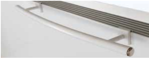
Sentimo handdoekhouder Curve