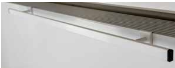
Sentimo handdoekhouder Straight